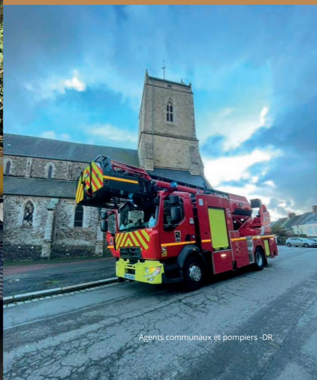
Agents communaux et pompiers

N'hésitez pas à vous faire connaître à l'accueil de la mairie si vous souhaitez participer à l'effort citoyen dans le cas d'une nouvelle crise.