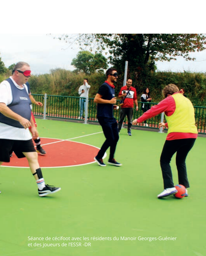
Séance de cécifoot avec les résidents du Manoir Georges-Guénier et des joueurs de l'ESSR