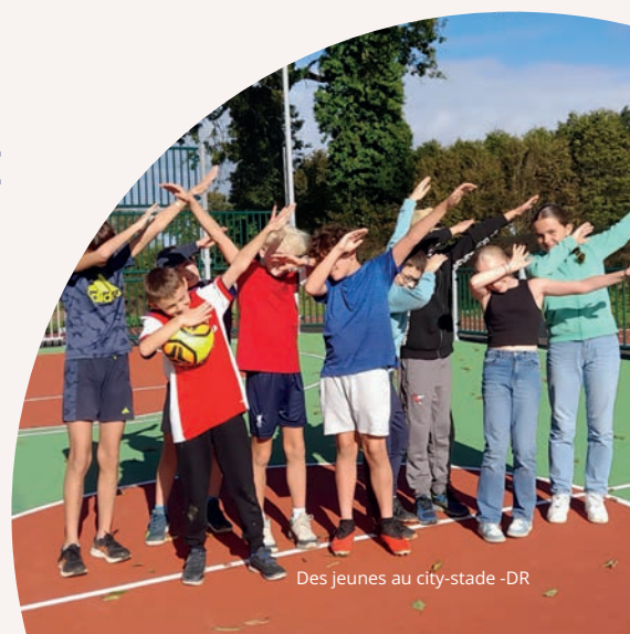
Des jeunes au city-stade