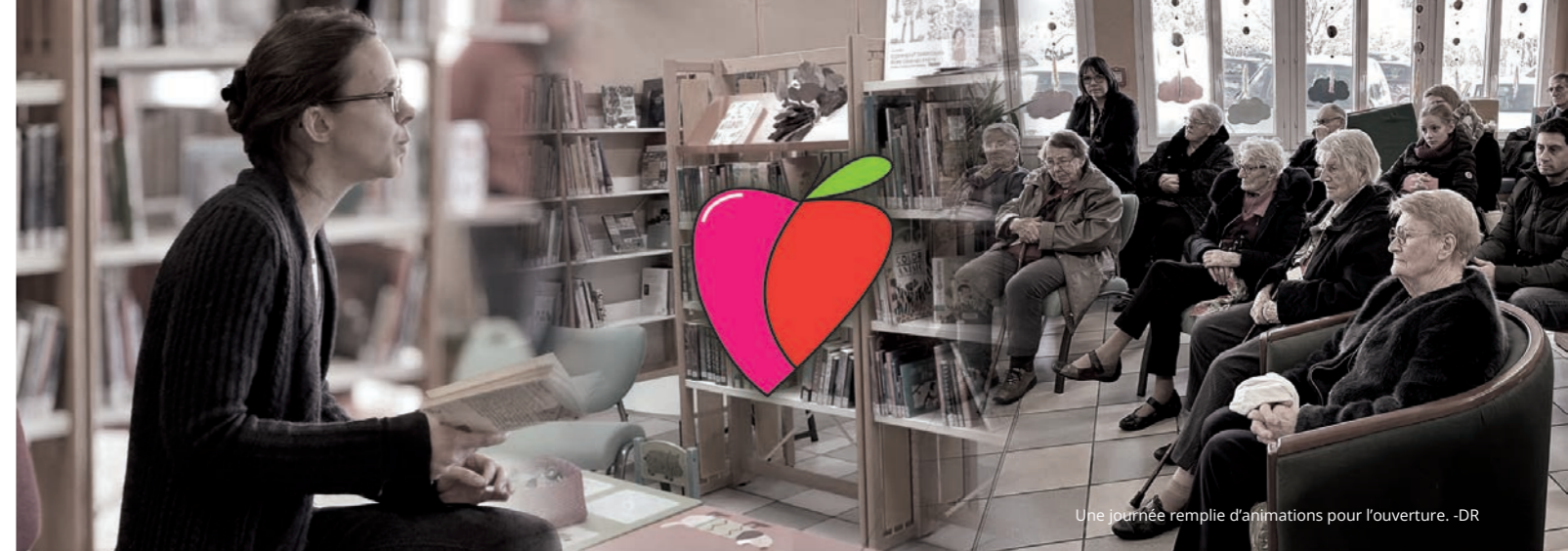
Une journée remplie d'animations pour l'ouverture.

La place centrale de la commune est aujourd'hui un lieu sur lequel se réunissent les habitants pour se donner rendez-vous ou sur lequel les associations organisent leurs festivités. Aujourd'hui, l'aménagement de la place est totalement minéral et en mauvais état. Le projet vise donc à changer l'image et l'identité de la place, d'un parking à un lieu de vie convivial.