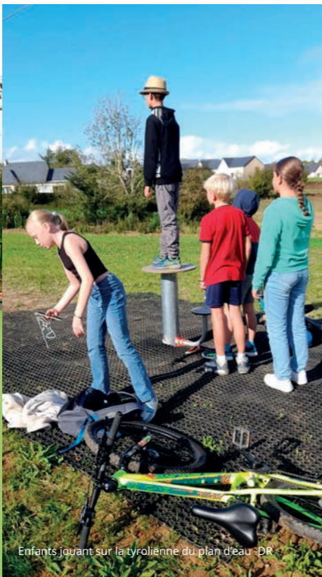
Enfants jouant sur la tyrolienne du plan d'eau